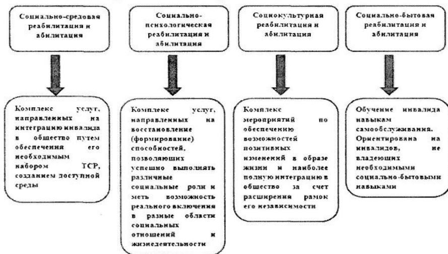
Содержание социальной реабилитации или абилитации

Основанием для разработки перечня мероприятий ИПРА является поступление в ОГБУ «Управление социальной защиты и социального обслуживания населения по Жигаловскому району» выписки, из индивидуальной программы реабилитации или абилитации инвалида, (ребенка-инвалида), выдаваемых